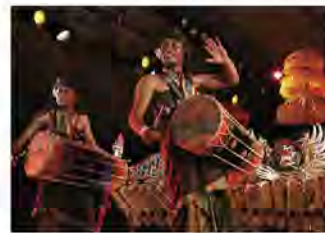
スアール・アグン