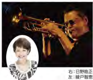
右:日野皓正 左:綾戸智恵