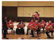
第13回定期演奏会より