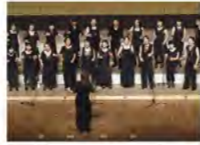
えずこミュージックアカデミーコンサート19thより