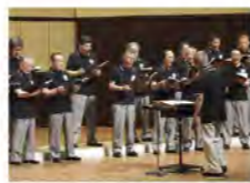
えずこミュージックアカデミーコンサート19thより