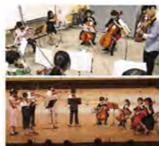
上: 練習風景 下: えずこミュージックアカデミーコンサート19thより