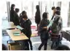
公演時のもぎり・受付の活動