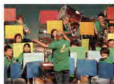
第17回チャリティコンサートより