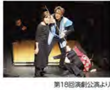
第18回演劇公演より