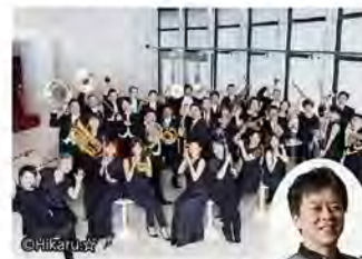
左:シエナ・ウインド・オーケストラ 右:須川展也