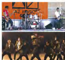
上: AZミュージックフェスティバル19thより 下: DAN DAN DANCE & SPORTS 12thより